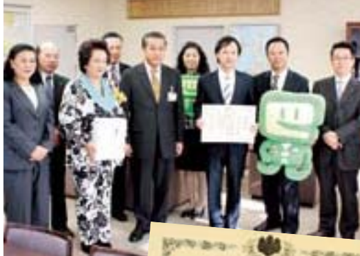
今年にはさらに租税教室の開催回数が増やす予定

次代を担う子どもたちに租税の意義や役割を正しく学んでもらう租税教育活動を行うべく、今年度はさらなる拡充を目指している。青年部会、女性部会ともに、昨年を大きく上回る九校の小学校での実施を予定している。