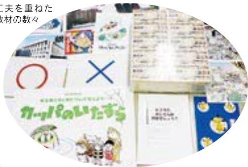
工夫を重ねた 教材の数々

なお、今年度の十二月から一月にかけて金沢市では、野町小、新野町小、東浅川小、南小立野小、菊川町小、米丸小、津幡町では中条小にて「租税教室」の実施を予定している。