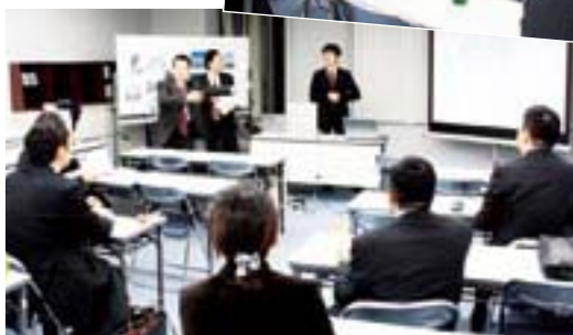
「今のやり方はどう だった？もっとうい アイデアはない？」