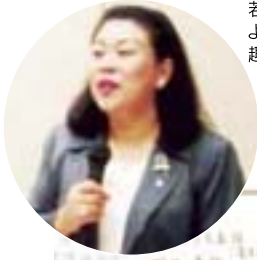
若松委員長の より開催の 趣旨を説明。