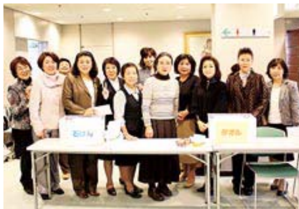
タオル、石鹸の寄贈は施設の方たちに大変喜ばれている。