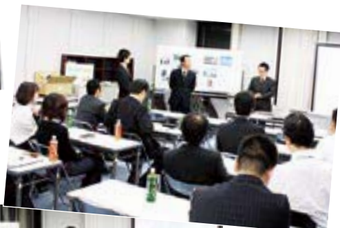
講師経験者 の意見を 聞きながら。