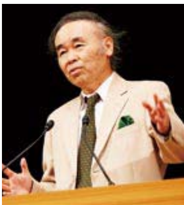
藤原正彦氏の講演に勇気付けられた人も多かったのでは。