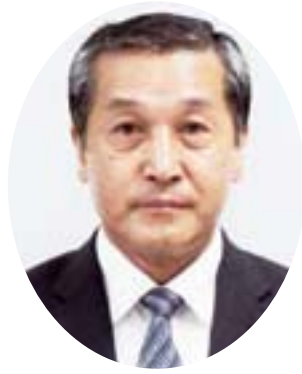
金沢税務署長 竹内 取平