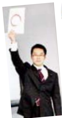
田野口委員長が 講師を講演