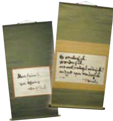
大拙の手による書

明治三年、本多家の医師の子として金沢市本多町に生まれる。禅仏教等の東洋思想を世界に広めた人物として知られ、英語や日本語の著作が世界各国で出版されています。