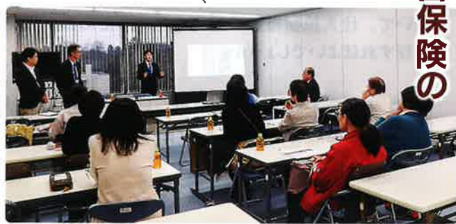
能登半島地震から1か月、時宜を得た内容だった。

あると説明を受けました。今回の研修で得た情報で、取引先などに適切なアドバイスが出来ることで大変助かりました。この時期に開催を手配頂きました事務局、及びAIG損害保険株式会社に様には大変お忙しい中をやり取りして頂きましたこと、感謝に堪えません。