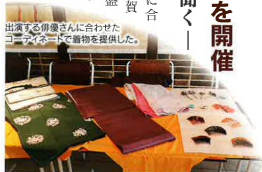
出演する俳優さんに合わせたコーディネートで贈物を提供した。