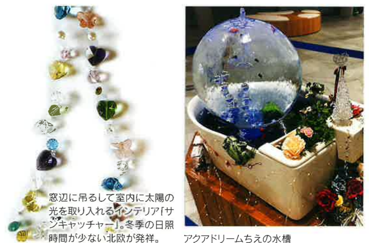
窓辺に吊るして室内に太陽の光を取り入れるインテリア「サンキャッチャー」。冬季の日照時間が少ない北欧が発祥。

平成九年、特許取得しましたが、周りからこんなものできるわけがないといふん言われました。試行錯誤を重ねて完成した「アクアドリームちえの水槽」は下部水槽と上部水槽が一体化され、上部水槽の天辺から水が表面を流れ上