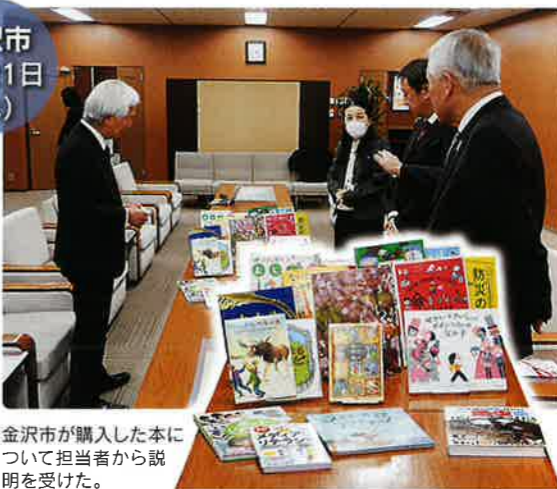
金沢市 2月21日(水) 金沢市が購入した本について担当者から説明を受けた。