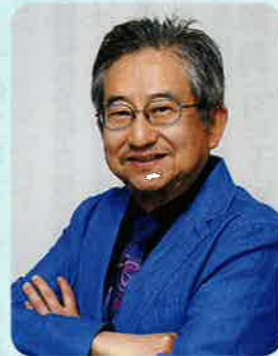
〔講師プロフィール〕

1945年、石川県輪島市生まれ。石ノ森章太郎氏のアシスタントを経て、1967年「目明しボリ吉」でデビュー。翌年「ハレンチ学園」の連載開始で大ブームとなる。2009年には、輪島市に永井豪記念館がオープン。2018年、第47回日本漫画家協会賞 文部科学大臣賞受賞。代表作には「テビルマン」「マジンガー-Z」「キューティーハニー」等、多数ある。