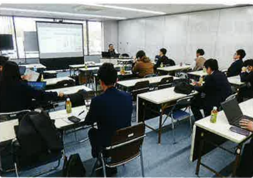
第1回は入り口として、プロジェクトの概要や進め方を説明した。