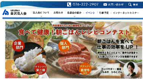
毎日バランスの取れた朝ごはんを食べると、健康にいいだけでなく、仕事や勉強の効率がアップします。金沢法人会では「朝ごはんレシピコンテスト」を開催し、優秀なレシピを表彰します。

また、フィジカル(身体的健康)、メンタル(精神的健康)、ソーシャル(社会的健康)の側面から自社が取り組む「健康経営宣言書」の提出の促進活動も行っていきます。