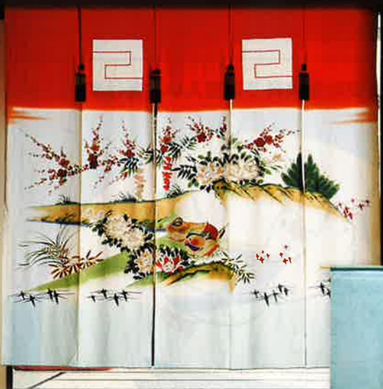
昭和に入ってから花嫁のれん(上)。絹の生地できた夏用のれんと一緒に持参した時代もあり、夏の法事等で掛けられた(右)。

明治の頃は木綿に藍染めでおめでたい模様が描かれたそうですが、次第に絹に友禅で染められるようになりました。青や紫が主流だった色も赤が好まれるようになり、その時代、時代の流行を映して絵柄も変わってきました。近年は持参する人が少なくなった一方、式場で飾る、新郎新婦の入場でくぐるなど、花嫁のれんの風習は形を変えて残されていくようです。