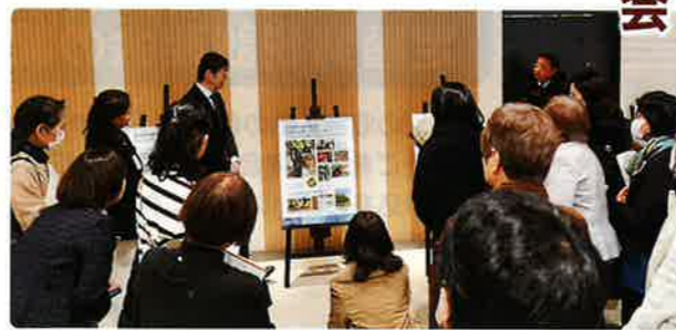
旧店舗敷地内にあるタブノキについて紹介するパネルも。

新店舗は総工費約六十六億円の三階建て、外観はダイクグレイで一階エントランスに戸室石、ロビーには能登産珪藻土、二階ホールには能登ヒバが使用されるなど、地産地消に取り組まれました。歴史を辿ると、金沢支店は日本海側で初の出張所として、全国で九番目に開設されたということ