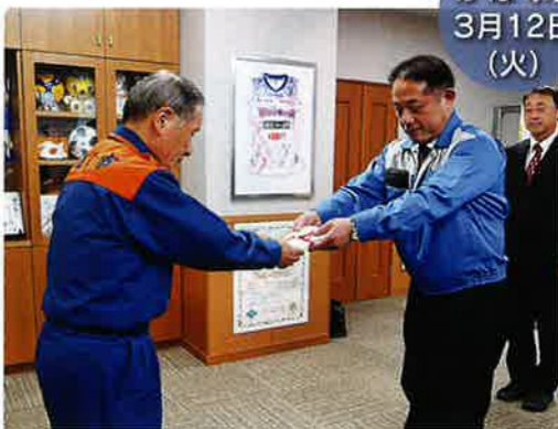
かほく市 3月12日(火) 表かほく支部長(右)から油野市長へ、目録が贈呈された。