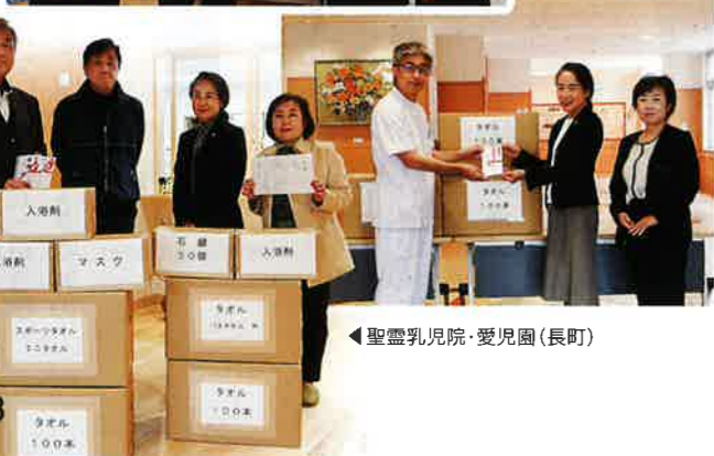
◀聖霊乳児院・愛児園(長町)