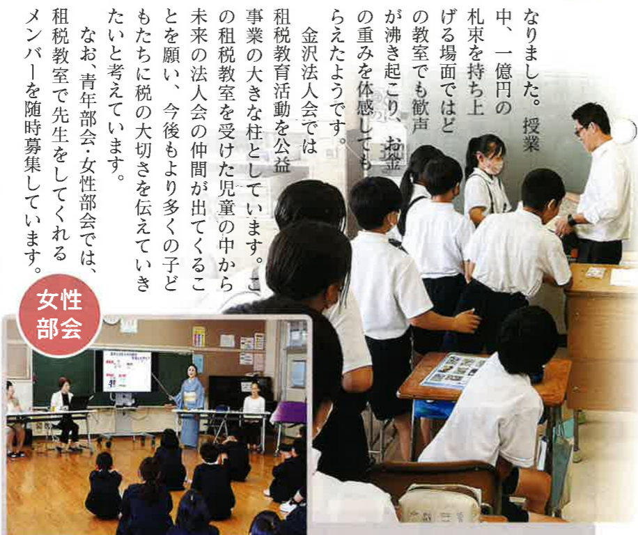
【女性部会実施 2校】 5月10日 金沢市立馬場小学校(20名) 5月12日 金沢市立額小学校(75名)

なお、青年部会・女性部会では、租税教室で先生をしてくれるメンバーを随時募集しています。