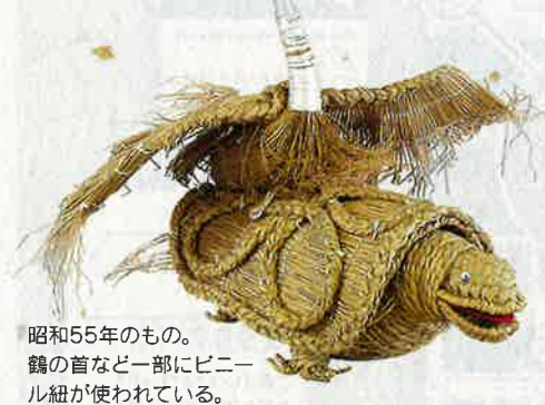
昭和55年のもの。鶴の首など一部にビニール紐が使われている。

加賀地方の平野部では、わら細工の鶴亀を持参する風習がありました。鶴を赤飯の上に、亀を米俵の上に載せて嫁入り道具の先頭に据え、嫁ぎ先に着くと祝い唄の後、最初に家に運び込んで飾ったと言います。