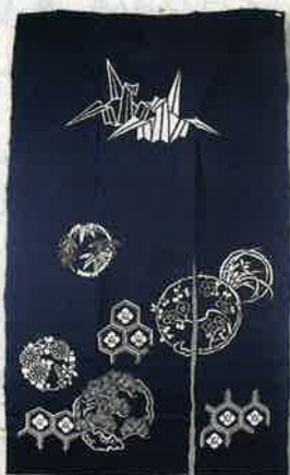
木綿に藍染めの明治時代の花嫁のれん。

明治時代ののれんは木綿に藍染が主流でした。それが絹になり、華やかな赤が主流に。古くは鶴亀などが好まれた絵柄も鳳凰や唐獅子、夫婦仲を象徴するオシドリと流行を映しながら、時代とともに変わってきました。