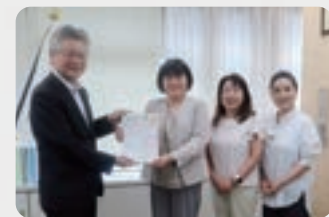
▲8月6日 絵はがきコンクール協力依頼