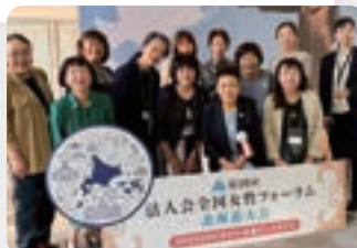
9月18日 女性フォーラムにて▶