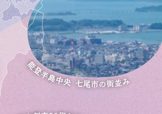
能登半島中央 七尾市の街並み