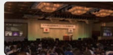
▲9月18日 女性フォーラム北海道大会 記念講演