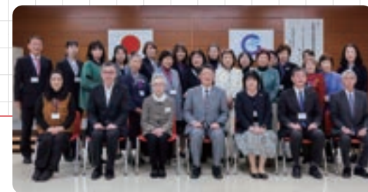
最後までご参加いただいた七尾市長(左)と研修者