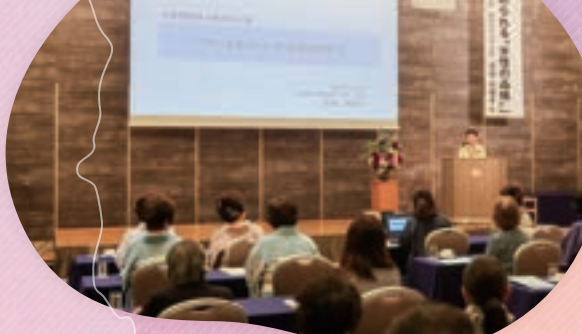
女性部会創立30周年記念講演会にて

公益社団法人 金沢法人会女性部会 Kanazawa Women's Corporate Association