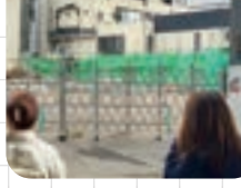
▲未だ解体中の施設も